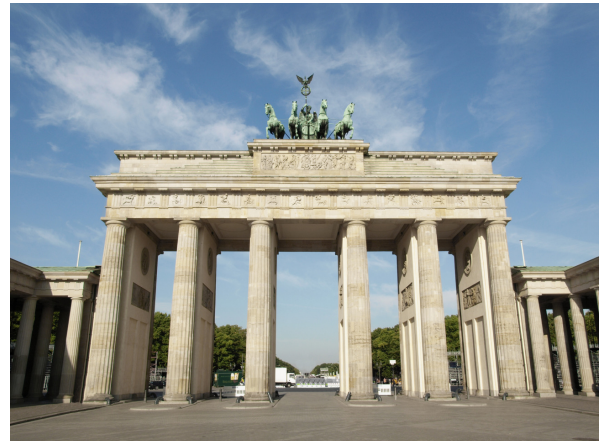
Brandenburgi väravad, Berliin

➤ Atraktiivne ettevõtete hinnatase - üsnagi levinud ettevõtete suhtelise hinnataseme mõdik - hinna/kasumi suhtarv (P/E ratio) on DAX indeksil kõigest 12,3 ja oodatav 2011 aasta vastavaks suhtarvuks on 10,7. Võrdluseks olgu toodud teiste arenenud riikide enamjalgitavate indeksite USA S&P500 indeksi (P/E 14,9), Suur-Britannia FTSE 100 indeksi (P/E 14,2) ning Jaapani Nikkei 225 indeksi (P/E 16,8) näidud.